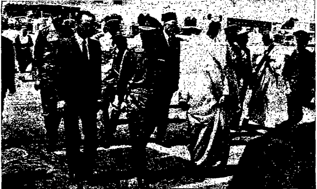
الحسين لدى مغادرته الرياض امس وفي وداعه جلالة الملك فيصل وجلالة الملك الحسين الثاني

عمان - وصل جلالة الملك الحسين المعظم ، بعد ظهر امس الى عمان قادما من المملكة العربية السعودية ، يصحبه سمو الامير حسن ولي العهد المعظم والسيد بهجت التلهوني رئيس الوزراء والوفد المرافق لجلالته . وكان في مقدمة المستقبين سمو الامير محمد المعظم وسو الامير نيفيد وسيد قريش النديان الملكي المهدي ورئيس مجلس الاعيان ورئيس مجلس القوابوزير الابلان والوزراء وكبار رجال الدولة والجيش والامن العام وجهات القطاع ورئيسه الطوائف الروحية . وقد جرى لجلالته استقبال رسمي وشعبي حافل في مطار عمان ، حيث اطلقت الخفيمه احدى وعشرين طلقة تحية لجلالته وزعت الموسيقى السلام الملكي الرديني . وبعد ان استلم جلالته حرس الشرف صالغ متلقيه ، ثم فخر جلالته يصحبه سمو الامير حسن ولي العهد المعظم وسو الامير محمد المعظم المطار وسط هتافات الجماهير بوجه جلالته . وكان جلالة الملك الحسين المعظم قد قام بجولة بدأها يوم الاثنين الماضي شملت العراق والكويت والبحرين وقطر وايبو قبي وبنين والمملكة العربية السعودية ، اجري خلالها محادثات مع قادة هذه الدول الشقيقة حول الوضع العربي الراهن والعمل العربي المشترك لاجلها المستقل .